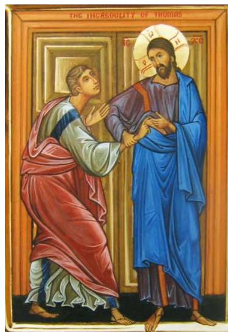
DIMANCHE DE THOMAS